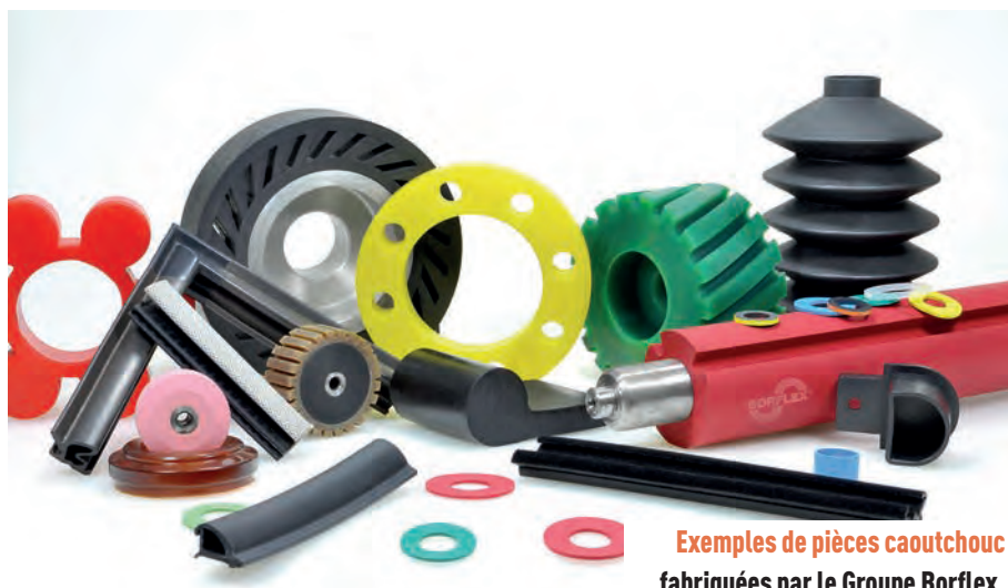
Exemples de pièces caoutchouc fabriquées par le Groupe Borflex.