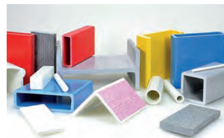
Exemples de profilés composites fabriqués par le Groupe Borflex.